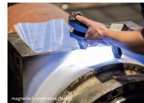
magnetisch onderzoek (MME)