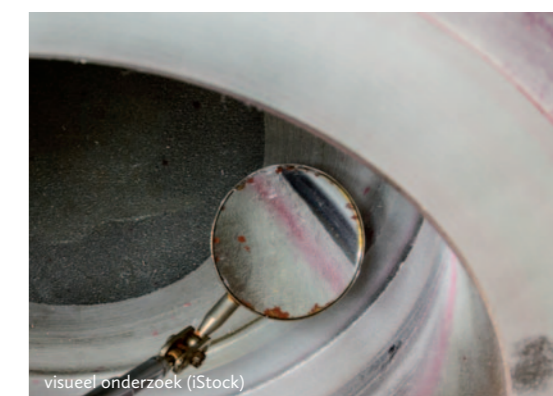
visueel onderzoek