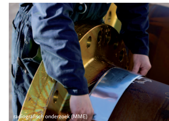
radiografisch onderzoek (MME)