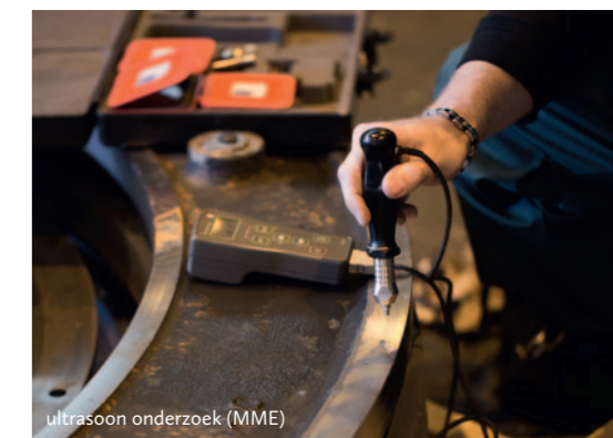
ultrasoon onderzoek (MME)

Alle vervaardigingsnormen verwijzen naar de EN-ISO 17635. Desondanks is deze norm nog onbekend bij menig lascoördinator. De EN-ISO 17635 beschrijft, naast de algemene regels voor de keuze van NDO-methoden, ook de samenhang tussen een NDO-methode, de specifieke onderzoeksnorm en de acceptatiecriteria. Schematisch is dit weergegeven in figuur 1.