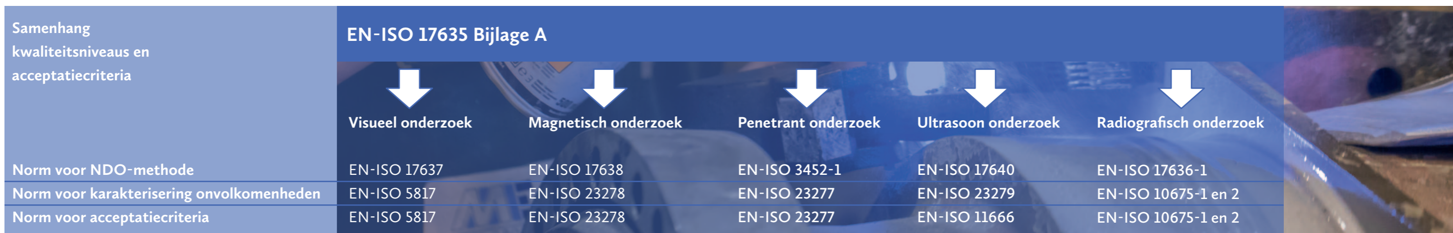
Figuur 1 Samenhang NDO-normen, kwaliteitsniveaus en acceptatiecriteria

Door verwijzing naar de EN-ISO 17635 wordt de samenhang tussen de EN-ISO 5817 en de NDO-normen zichtbaar. Nu kunnen we vanuit Bijlage A van de EN-ISO 17635 het kwaliteitsniveau van de EN-ISO 5817 koppelen aan de onderzoekstechnieken en de aanvaardbaarheidsniveaus van de verschillende NDO-methoden. In figuur 2 is dit uitgewerkt voor VT, MT en UT.